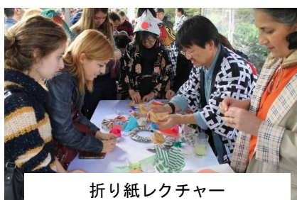
折り紙レクチャー