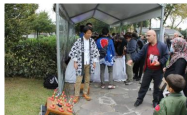
日本紹介スタンドの輪投げコーナー

けん玉体験コーナー、輪投げチャレンジコーナー及び日本語で自分の名前を腕などに書くコーナーなど、子ども達を中心に人気を博しました。