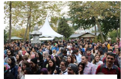
お祭りに訪れた市民

今般、イスタンブール大市サルエル市に所在するバルタリマヌ日本庭園にて、伝統文化からポップカルチャーまで、幅広い分野における日本文化紹介イベントが開催されました。直前まで天候が心配されましたが、当日は晴天に恵まれ、1200人以上の参加者で会場は活気にあふれました。