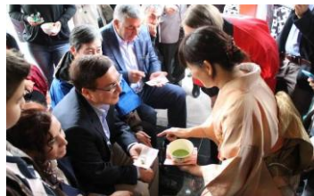
薄茶と和菓子を体験する来賓

及び薄茶と和菓子の体験 日土婦人友好文化協会による茶道デモンストレーション後、薄茶及び当地にある材料でできる和菓子を皆様に体験していただきました。サリエル郡長、サリエル市長など、プロトコルの方々にも味わっていただきました。