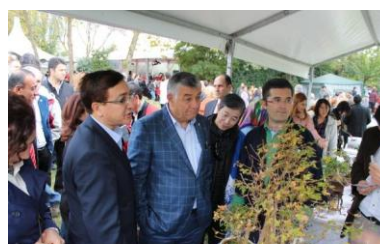
盆栽の説明に聞き入る来賓

イスタンブール盆栽による現地の植物による多数の盆栽展示。希望により盆栽剪定の仕方も披露しました。