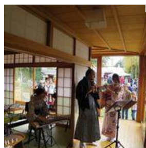
箏とフルートのコンサート

君府芙蓉の会の8名及びフルート奏者2名により、茶道デモンストレーションに合わせて、「さくら」や日本の童謡などの日本楽曲の演奏が行われました。