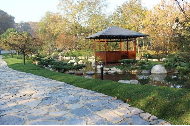
Tadilat Sonrası Bahçenin Genel Görünümü

Baltalimanı Japon Bahçesinin bu seferki onarımında İstanbul Büyükşehir Belediyesi tarafından Shimonoseki Belediyesine onarım işbirliği talebi alınarak, Japonya tarafından gönüllü Japon firmaları tarafından 'Baltalimanı Japon Bahçesi Onarım Projesi Komitesi'ni kurdu ve Shimonoseki Belediyesi Bahçe Düzenleme Kulübü yetkilileri tarafından İstanbul'a ziyaret yapılarak , İstanbul Büyükşehir Belediyesi Park Bahçe ve Yeşil Alanlar Daire Başkanlığı yetkilileriyle beraber, taşlı yolların yenilenmesi, fidan dikimi, çim alanların yenilenmesi, bahçe etrafındaki çitlerin düzenlenmesi gibi çalışmalar yapıldı. Ayrıca bu tadilatla çay evinin iç kısmı da estetik bir düzenlemeyle yeniden doğmuş gibi oldu.