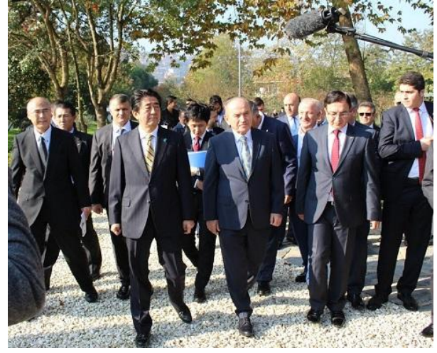
Bahçeyi Gezen Başbakan Abe ve Katılımcılar

Baltalimanı Japon Bahçesinin bu seferki onarımında İstanbul Büyükşehir Belediyesi tarafından Shimonoseki Belediyesine onarım işbirliği talebi alınarak, Japonya tarafından gönüllü Japon firmaları tarafından 'Baltalimanı Japon Bahçesi Onarım Projesi Komitesi'ni kurdu ve Shimonoseki Belediyesi Bahçe Düzenleme Kulübü yetkilileri tarafından İstanbul'a ziyaret yapılarak , İstanbul Büyükşehir Belediyesi Park Bahçe ve Yeşil Alanlar Daire Başkanlığı yetkilileriyle beraber, taşlı yolların yenilenmesi, fidan dikimi, çim alanların yenilenmesi, bahçe etrafındaki çitlerin düzenlenmesi gibi çalışmalar yapıldı. Ayrıca bu tadilatla çay evinin iç kısmı da estetik bir düzenlemeyle yeniden doğmuş gibi oldu.