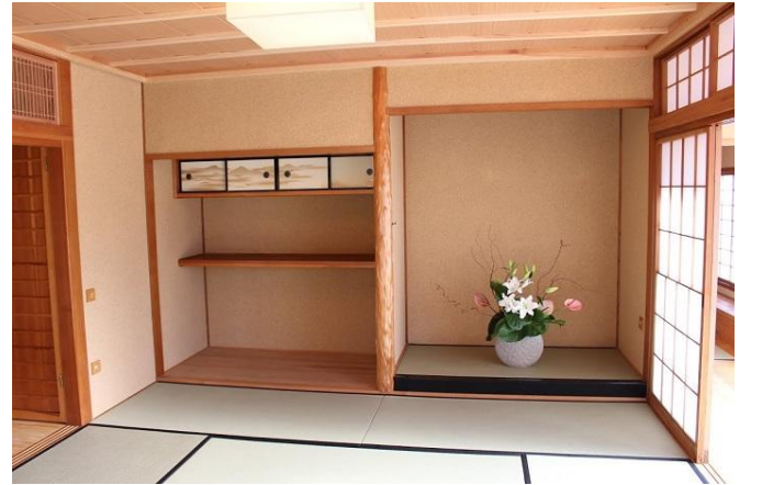
Çay evinin salonu

Tören sonrasında bahçenin yeniden açılmasını bekleyen çok sayıda İstanbullu bahçeyi ziyaret ettiler. Baltalimanı Japon Bahçesi, yıl boyunca her gün 07.00-17.00 saatler arası açıktır ve giriş ücretsizdir.(Bahçe yönetimi İstanbul Büyükşehir Belediyesi Parklar ve Bahçeler Müdürlüğü tarafından yapılmaktadır) Herkesi bu güzel bahçeye bekliyoruz.