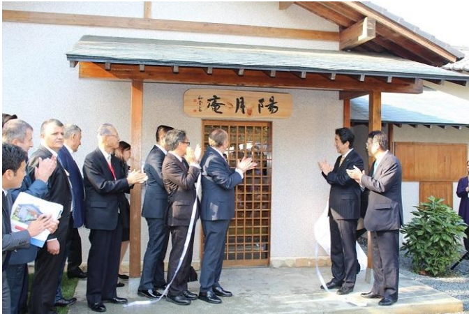
Yogetsuan tabelası perde açılışı

Devamında, tadilat gören çay evi Yogetsuan olarak isimlendirilerek önündeki tabelanın açılış yapıldı Yogetsuan iki ülke bayraklarının sembolü sayılan güneş (Japonya) ve ay(Türkiye) ile iki ülkenin ebedi dostluğu dilekleriyle isimlendirilmiştir.