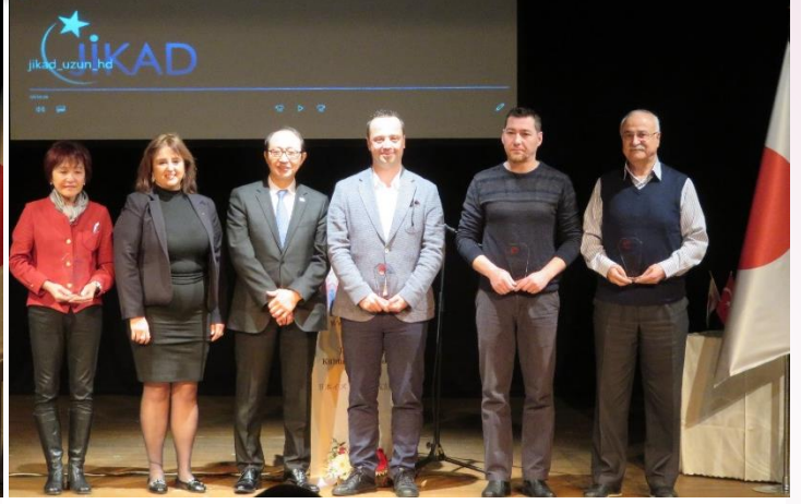
İşbirlikçilerle Hediye Takdimi