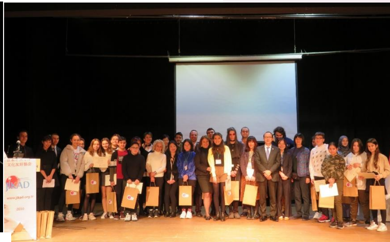
Ödül Töreni Sonunda Jüri ile Yarışmacıların Hatıra Fotoğrafı