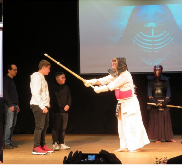
Kendo Tanıtımı ve Gösterisi