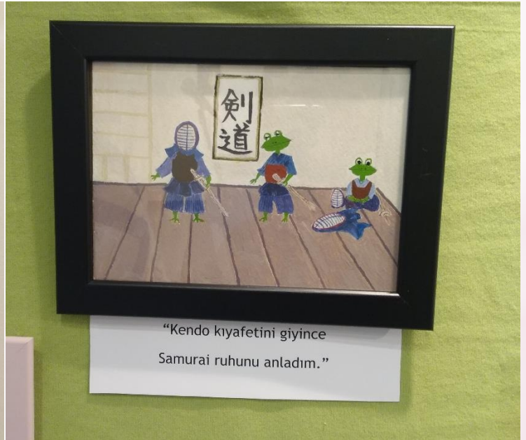
“Kendo kıyafetini giyince Samurai ruhunu anladım.”