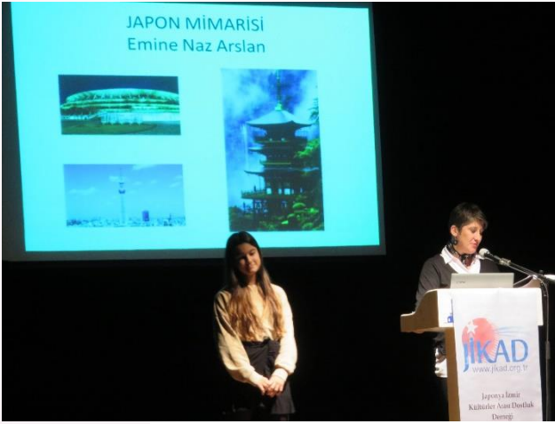
Japonya Tanıtım Bölümü Sonuçları Açılırken