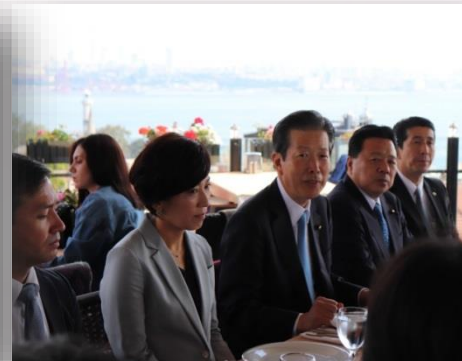
Japon Şirketleri ile Toplantı