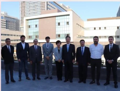
İkitelli Şehir Hastanesi İnşaatı Ziyareti