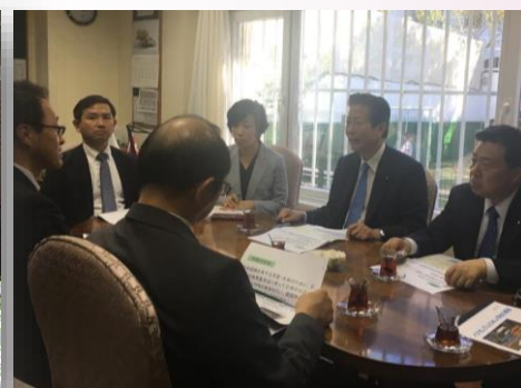
Japon Okulu Ziyareti