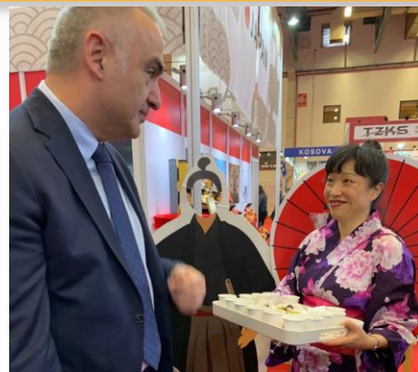
エルソイ大臣の日本ブース御視察の様子