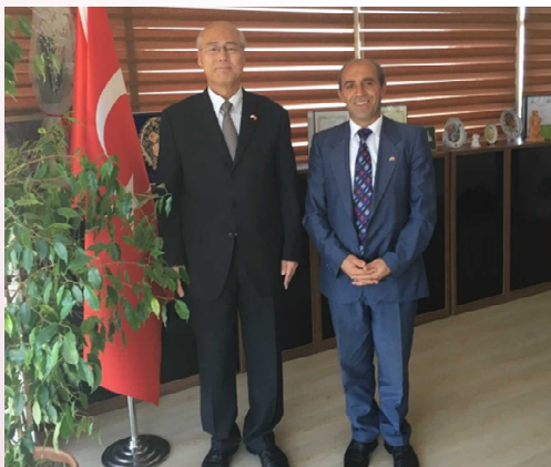
イーイトAFADブルサ防災館館長への表敬