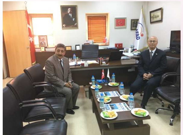
ムムジュAFADブルサ支局長への表敬