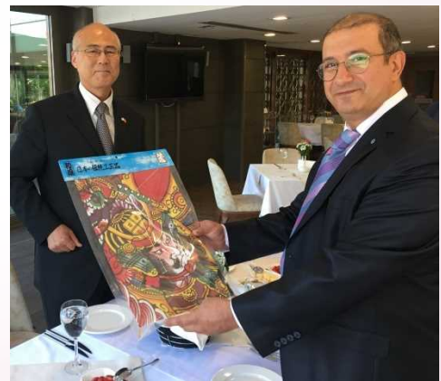
カプラン・ウルヤマ日本文化協会会長との懇談