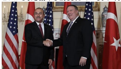
(写真は、6月4日付 M 紙インターネット版より)

4日、チャヴシュオール外相は、訪米先のワシントンで、ポンペオ米国防務長官と会談した。同会談では、主にシリアのマンビジを巡る問題、ギュレン氏の返還、F-35の購入等が協議された。同会談で両社は、PYDのマンビジからの撤退、トルコ・米兵士共同でのマンビジの治安維持等が含まれたロード・マップを承認した。同会談後の5日には、YPGが軍事顧問をマンビジから引き上げると発表している。(6月5日付 M 紙 17 面)