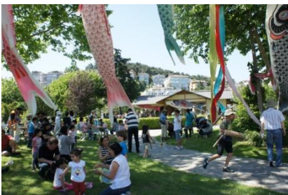
Koinobori'nin Çocuklara Tanıtımı

İstanbul Boğazı kıyısındaki ikamet bölgesine yakın bir yerde bulunan Japon Bahçesi, baharda Belediyenin düzenlediği 'Sakura sevenler Etkinliği', her yıl Mayıs ayında geleneksel olarak 'Koinobori' (Japon Balık Uçurtması) etkinliği (Uçurtmalar 2010 yılında Yamaguçi Ekonomik Dostluk Topluluğu tarafından başlanmıştır) gibi bahçenin 4 mevsim konseptine uygun olarak etkinliklerin düzenlendiği ve İstanbul Halkının dinlendiği bir bahçe haline gelmiştir.