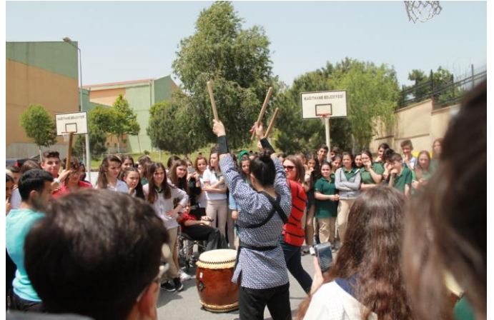
和太鼓のデモンストレーション