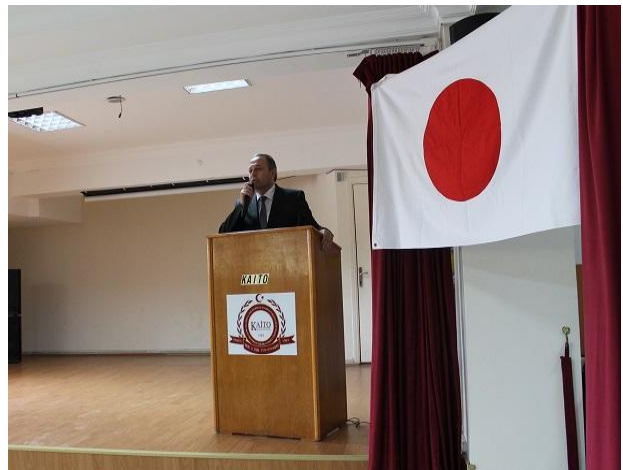
ギョチ郡長の挨拶