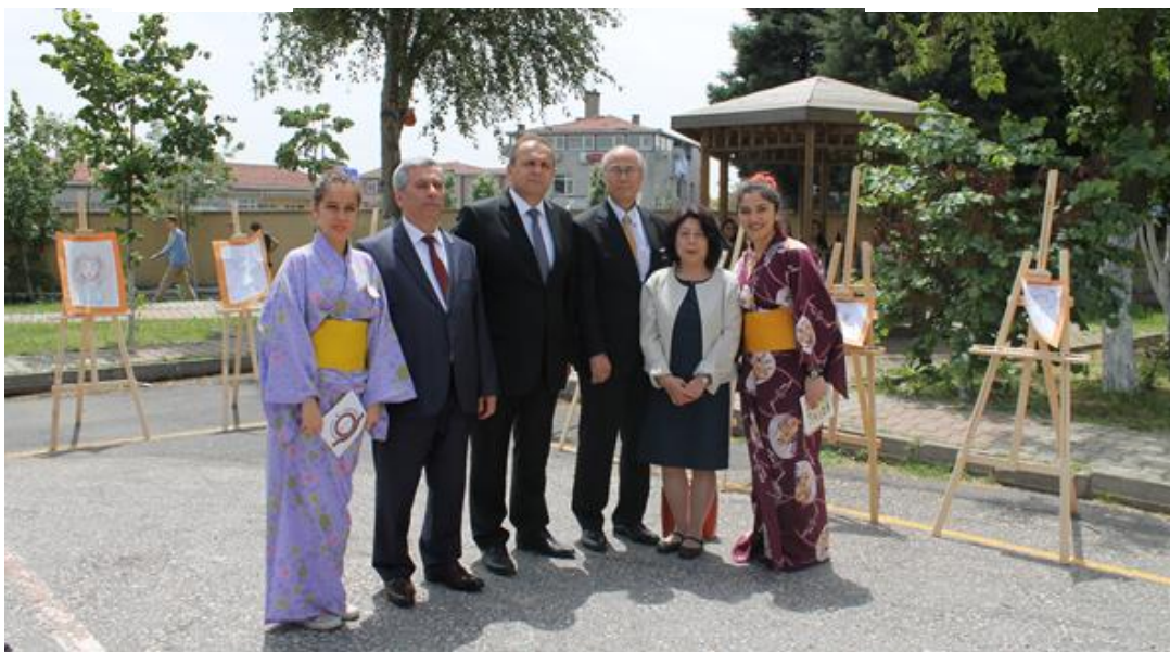
ギョチ郡長、チャユル教育長、司会者の女子生徒と江原総領事夫妻